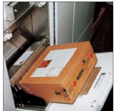
Alle notwendigen Chemikalien für die Papierentwicklung werden in einer praktischen Box geliefert, die einfach an das Gerät angesetzt wird.

Mit dem d-lab.2 bietet Agfa-Gevaert Minilab-Anwendern nicht nur ein erstklassiges Gerät, sondern auch die gesamte Dienstleistungspalette, mit der die Verantwortlichen des Geschäftsfeldes Laborgeräte ihre Kunden unterstützen. Dazu gehört zum Beispiel im Vorfeld des Verkaufs eine sorgfältige Standortanalyse und die Beratung, wie ein erfolgreiches Minilab-Geschäft aufgebaut werden kann. Auch nach Installation des Gerätes bleiben die Agfa Service-Mitarbeiter in dieser Sache am Ball: Den Kunden stehen umfangreiche Trainingsmaßnahmen sowie technische und kaufmännische Unterstützung zur Verfügung. Dabei werden permanent neue Geschäftsmöglichkeiten für die Agfa Minilab Kunden entwickelt: von e-Commerce-Konzepten bis zu Strategien für den Filmverkauf und Ideen für attraktives Shop-Design im Rahmen des Agfa Image Center Konzepts. „Wir wissen, daß wir mit Geräten wie dem Agfa d-lab.2 nur so erfolgreich sein können wie unsere Kunden“, resümierte Dr. Michael Müller.